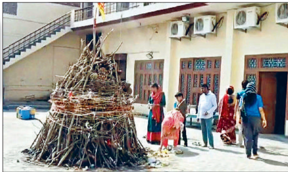
जीद। होलिका की पूजा करते हुए श्रद्धालु व होली पर्व को लेकर दुकान के बाहर सजाई गई पिचकारी।

जिलेभर में सोमवार को रंगों का खेल होली पर्व को लेकर लोगों ने होलिका की पूजा अर्चना कर सुखद भविष्य की कामना की। बाजार में रौनक छाई रही। लोगों ने जमकर गुलाल खरीदा। बच्चे पिचकारी खरीदने में पीछे नहीं रहे। भ्रष्टाचार के चलते देर रात को शहर में विभिन्न स्थानों पर होलिका दहन किया गया और पटाखे फोड़े। वहीं मंगलवार को चंद्रग्रहण होने के चलते बुधवार को फोंग खेला जाएगा। लोगों की आपातकालीन सेवा के लिए नागरिक अस्पताल इमरजेंसी वार्ड में चिकित्सकों की ड्यूटी लगा दी गई है और होली पर्व पर लड़ाई व झगड़े, दुर्घटना या किसी भी तरह की अप्रिय घटना से निपटने के लिए पुलिस प्रशासन के साथ-साथ स्वास्थ्य विभाग ने तैयारी पूरी कर ली है। शहर के बाजार पटियाला चौक, पुरानी