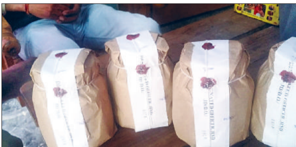
जींद। टीम द्वारा सील किए गए सैपल।