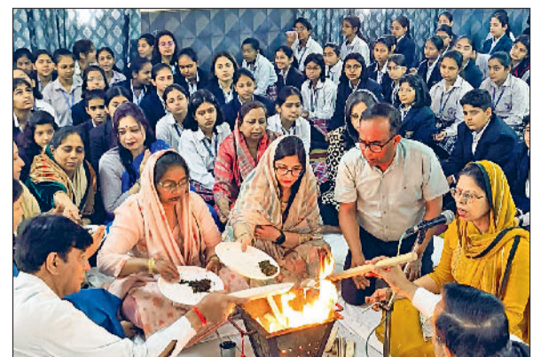
जीद। हवन में आहुति डालते प्रबंधक समिति पदाधिकारी।

राजौंद। गोल्ड लाइफ स्कूल में होली का पावन त्योहार रंगों और गुलाल के साथ बड़े उत्साह और आनंदपूर्ण वातावरण में मनाया गया। विद्यालय परिसर में चारों ओर अबीर-गुलाल की सुगंध और रंगों की छटा देखने को मिली। बच्चों ने एक-दूसरे को गुलाल लगाकर प्रेम, भाईचारे और सद्भाव का संदेश दिया। पूरा वातावरण हंसी-खुशी और सकारात्मक ऊर्जा से सजाकर नजर आया। कार्यक्रम के दौरान विद्यार्थियों ने केवल सूखे रंगों और गुलाल से ही होली खेली। विद्यालय प्रशासन द्वारा विशेष रूप से प्राकृतिक और हर्बल गुलाल के उपयोग पर जोर दिया गया, ताकि सभी छात्र सुरक्षित और स्वस्थ रहें। प्रत्येक कक्षा में रंगों के माध्यम से एकता और अपनत्व का भाव दिखाई दिया।