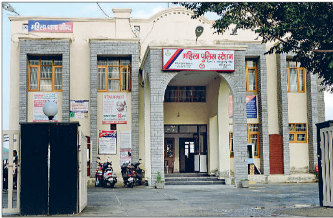
जींद का महिला थाना।

आईएमटी के लिए ई भूमि पोर्टल पर किसानों से प्रस्ताव मांगे जाएंगे। जींद में आईएमटी बनती है तो इसका फायदा यहां के युवाओं को मिलेगा। आज बेरोजगारी के चलते व जींद में कोई बड़ी इंडस्ट्री न होने के चलते युवाओं को दूसरे जिलों का रुख करना पड़ता है। ऐसे में अगर आईएमटी बनती है तो यहां के लोगों को फायदा होगा। धान की पराली से 200 मेगावाट क्षमता की बायोगैस परियोजनाएं स्थापित होंगी। प्रदेश