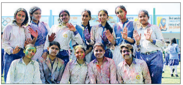
नरवाना। होली खेलते बच्चे।