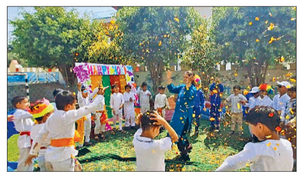
कैथल। फूलों संग होली खेलते इंडस पब्लिक स्कूल के विद्यार्थी।